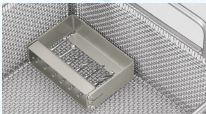
Fig. 1 Korrekt placering af instrumentenblokken i vaskemaskinen/desinfektoren